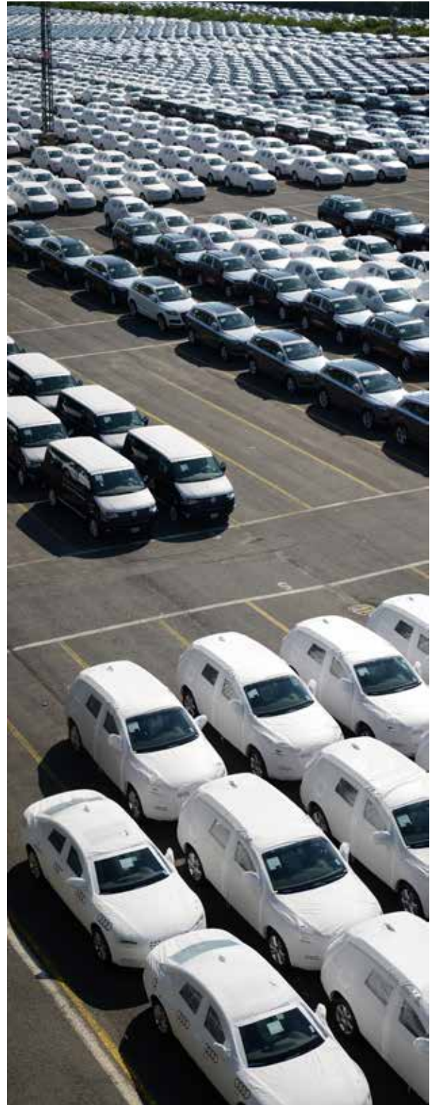
Logistik für die Automobilindustrie

Weitere Informationen zur Zusammensetzung von Vorstand und Aufsichtsrat finden sich im verkürzten Anhang unter sonstigen Angaben auf Seite 17.