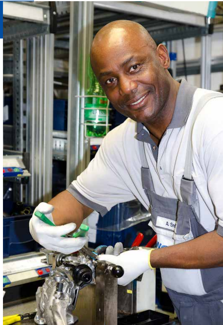
BLG-Mitarbeiter in Kölleda

Corporate Governance umfasst das gesamte System der Leitung und Überwachung eines Unternehmens einschließlich der Organisation des Unternehmens, seiner geschäftspolitischen Grundsätze und Leitlinien sowie des Systems der internen und externen Kontroll- und Überwachungsmechanismen. Corporate Governance strukturiert eine verantwortliche, an den Prinzipien der sozialen Marktwirtschaft und auf nachhaltige Wertschöpfung ausgerichtete Leitung und Führung des Unternehmens.