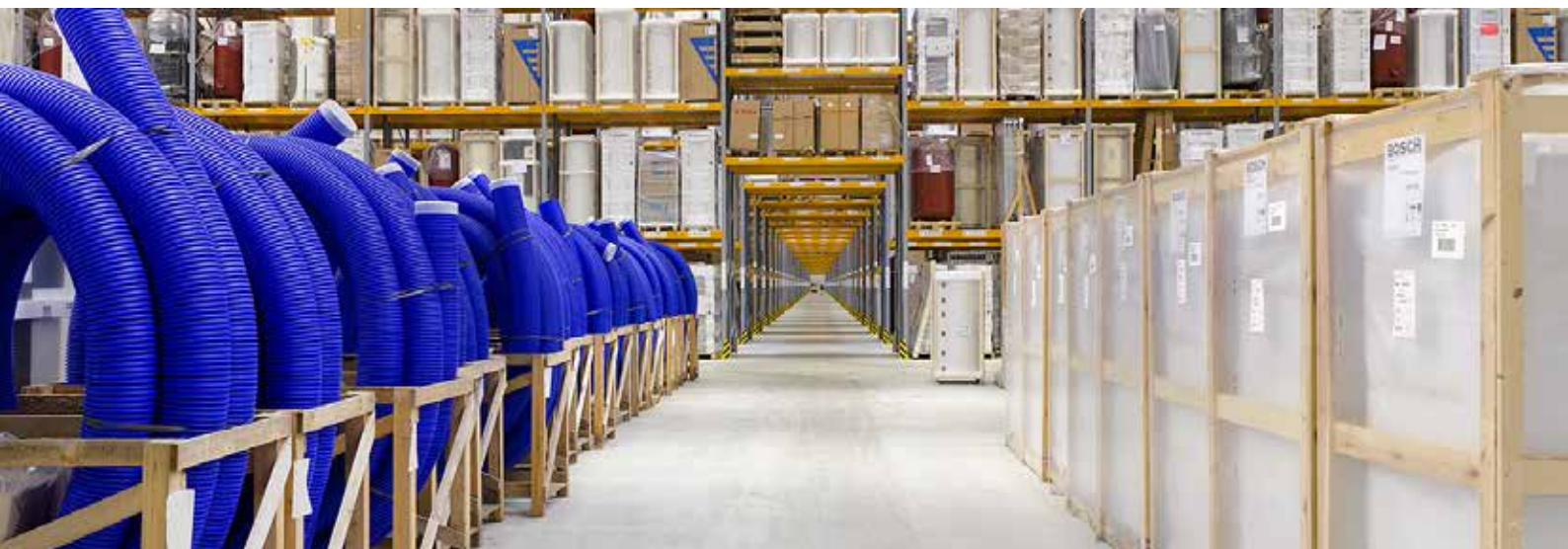
300-Meter-Blick durch die Lagerhallen im LC Butzbach

Dieser Zwischenbericht enthält zukunftsbezogene Aussagen, die auf aktuellen Einschätzungen des Managements über künftige Entwicklungen beruhen. Solche Aussagen unterliegen Risiken und Unsicherheiten, die außerhalb der Möglichkeiten der BREMER LAGERHAUS-GESELLSCHAFT –Aktiengesellschaft von 1877– bezüglich einer Kontrolle oder präzisen Einschätzung liegen,