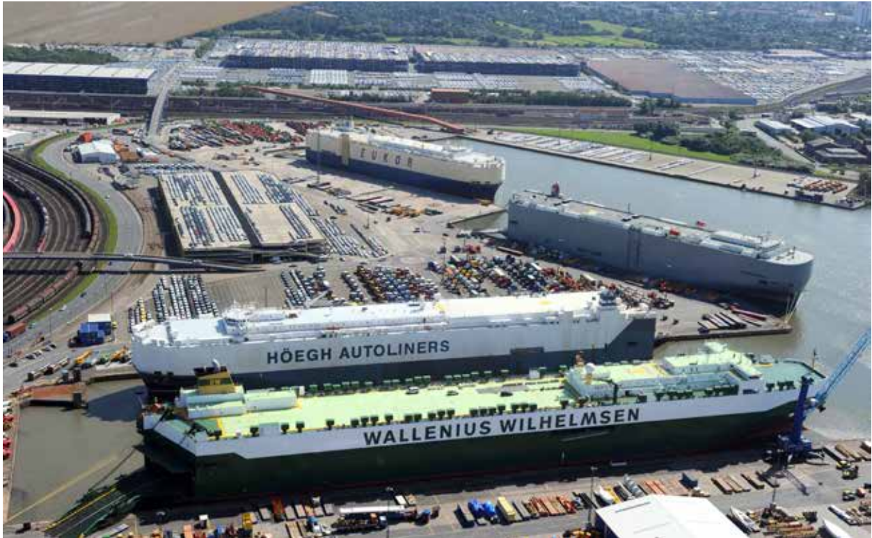
Autotransporter am BLG AutoTerminal Bremerhaven

zwischen 40 und 60 Prozent vom ruhegeldfähigen Jahreseinkommen, das deutlich unterhalb des jeweiligen Jahresgrundgehalts (feste Vergütung eines Vorstands) liegt. Die ruhegeldfähigen Jahreseinkommen der Vorstände werden analog zu den Tariferhöhungen des ZDS (Zentralverband der Deutschen Seehafenbetriebe) angepasst.