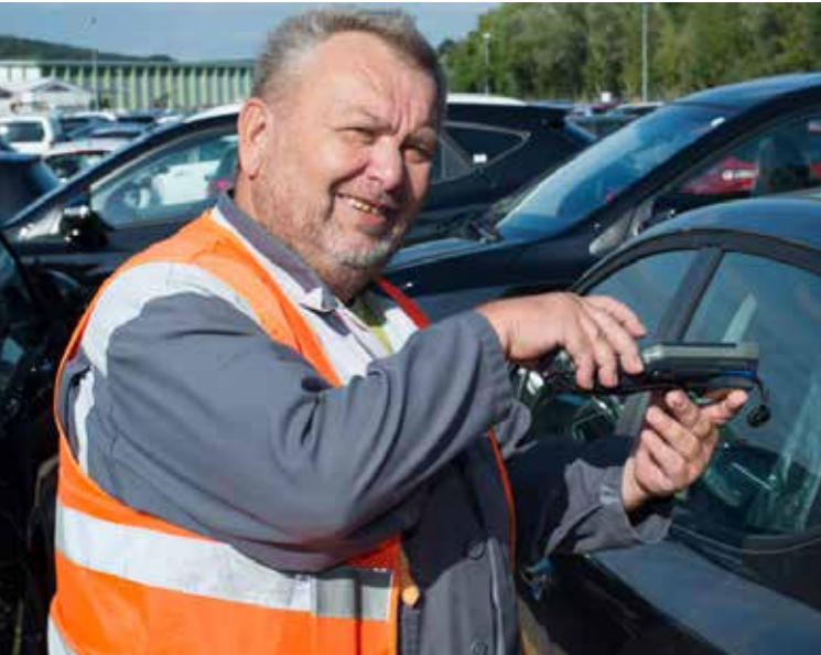
BLG-Mitarbeiter im AutoTerminal Kelheim