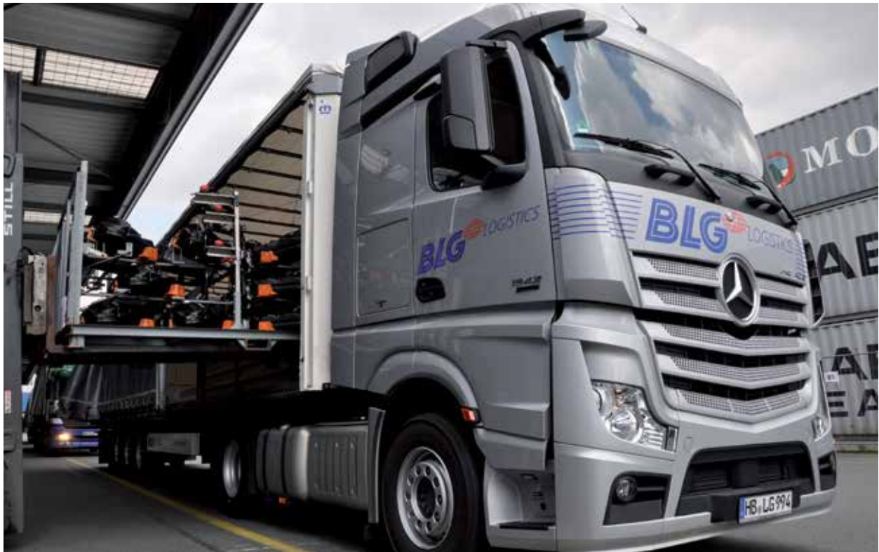
Logistik für die Automobilindustrie im LC Bremen

wie beispielsweise das zukünftige Marktumfeld und die wirtschaftlichen Rahmenbedingungen, das Verhalten der übrigen Marktteilnehmer, die erfolgreiche Integration von Neuerwerbungen und Realisierung der erwarteten Synergieeffekte sowie Maßnahmen staatlicher Stellen. Sollte einer dieser oder andere Unsicherheitsfaktoren und Unwägbarkeiten eintreten oder sollten sich Annahmen, auf denen diese Aussagen basieren, als unrichtig erweisen, könnten die tatsächlichen Ergebnisse wesentlich von den in diesen Aussagen explizit genannten oder implizit enthaltenen Ergebnissen abweichen. Es ist von der BREMER LAGERHAUS-GESELLSCHAFT –Aktiengesellschaft von 1877– weder beabsichtigt, noch übernimmt die BREMER LAGERHAUS-GESELLSCHAFT –Aktiengesellschaft von 1877– eine gesonderte Verpflichtung, zukunftsbezogene Aussagen zu aktualisieren, um sie an Ereignisse oder Entwicklungen nach dem Datum dieses Berichts anzupassen.