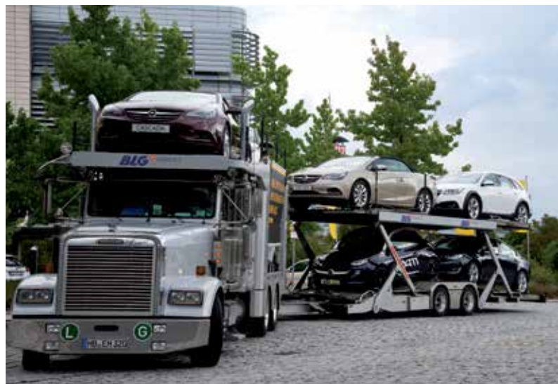
BLG-Freightliner im Einsatz für die IAA Frankfurt

Die Gesellschaft unterhält eine Zweigniederlassung in Bremerhaven.