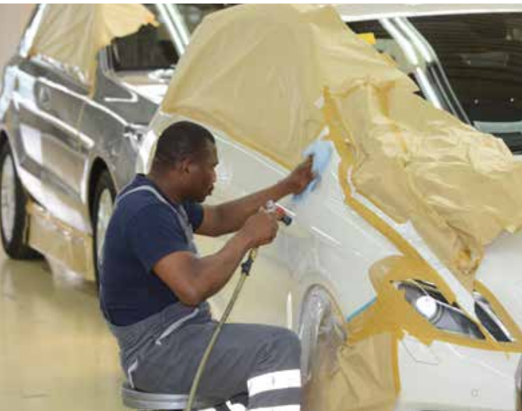
Technische Dienstleistungen für die Automobilindustrie