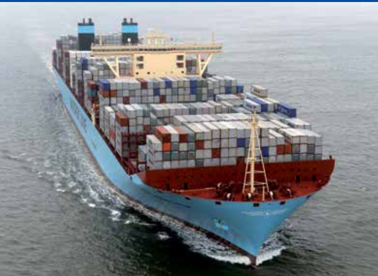
Containershipf der Triple-E-Klasse hält Kurs auf Bremerhaven