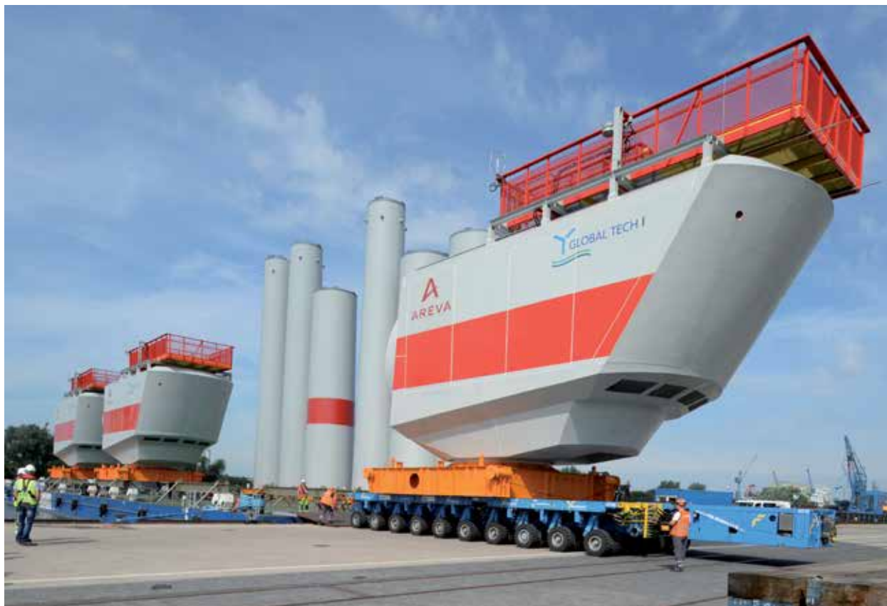
Gondelverladung auf dem BLG Offshore-Terminal ABC-Halbinsel Bremerhaven