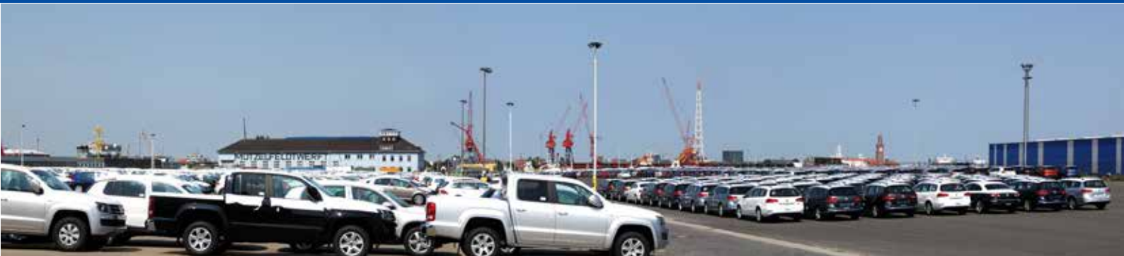
BLG AutoTerminal Cuxhaven