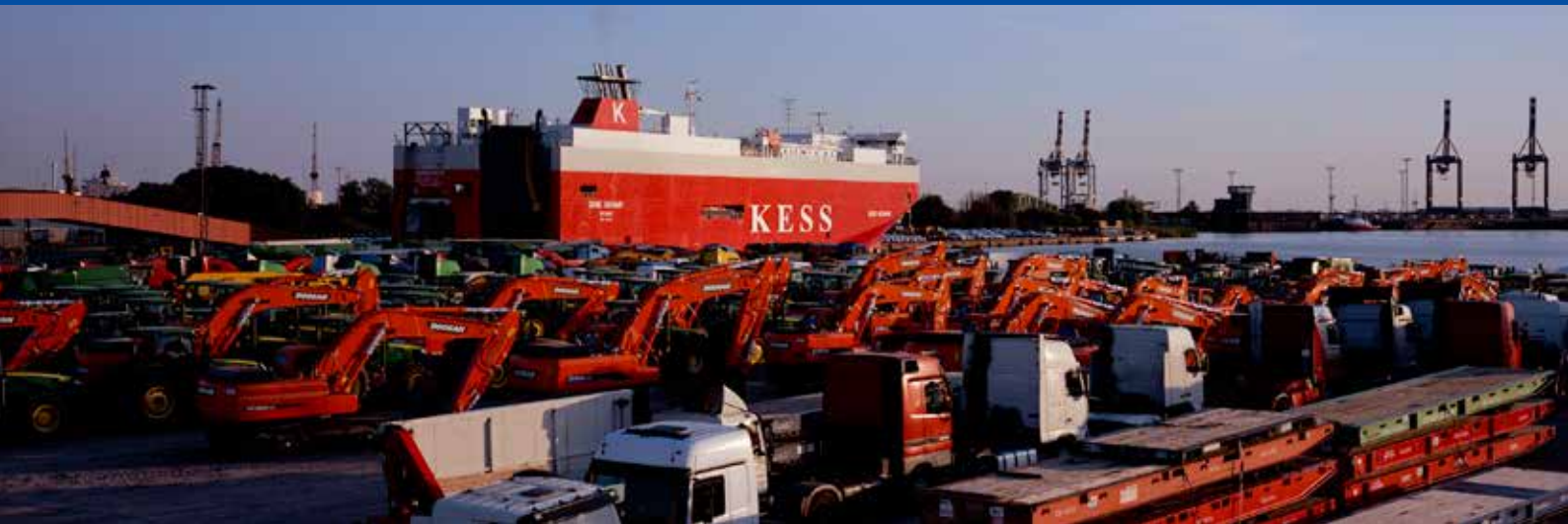
High & Heavy-Verladung in Bremerhaven