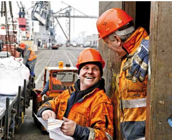
BLG-Mitarbeiter im Neustädter Hafen, Bremen

Sofern das Tantiembudget nach Gewährung der variablen Jahrestantieme noch nicht ausgeschöpft ist, steht der verbleibende Restbetrag für die variable nachhaltige Tantieme zur Verfügung. Diese wird in Abhängigkeit von der Erreichung des Konzernergebnisses vor Ertragsteuern (EBT) in den drei Folgejahren auf Basis der im Aufsichtsrat verabschiedeten Planung gewährt. Weiteres Kriterium ist das Erreichen des Return on Capital Employed (ROCE) auf Basis der mit dem Aufsichtsrat vereinbarten Dreijahresplanung. Damit stimmen die Kriterien für die Gewährung der Tantieme als Leistungsanreiz mit den im Konzern verwendeten Steuerungskennzahlen überein.