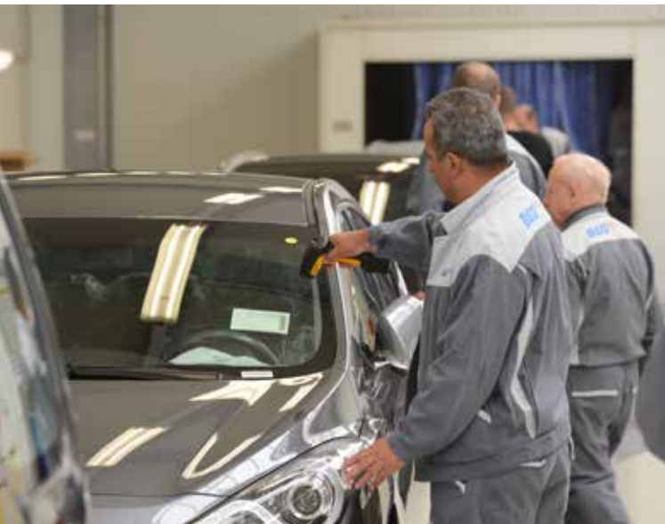
Technische Dienstleistungen für die Automobilindustrie