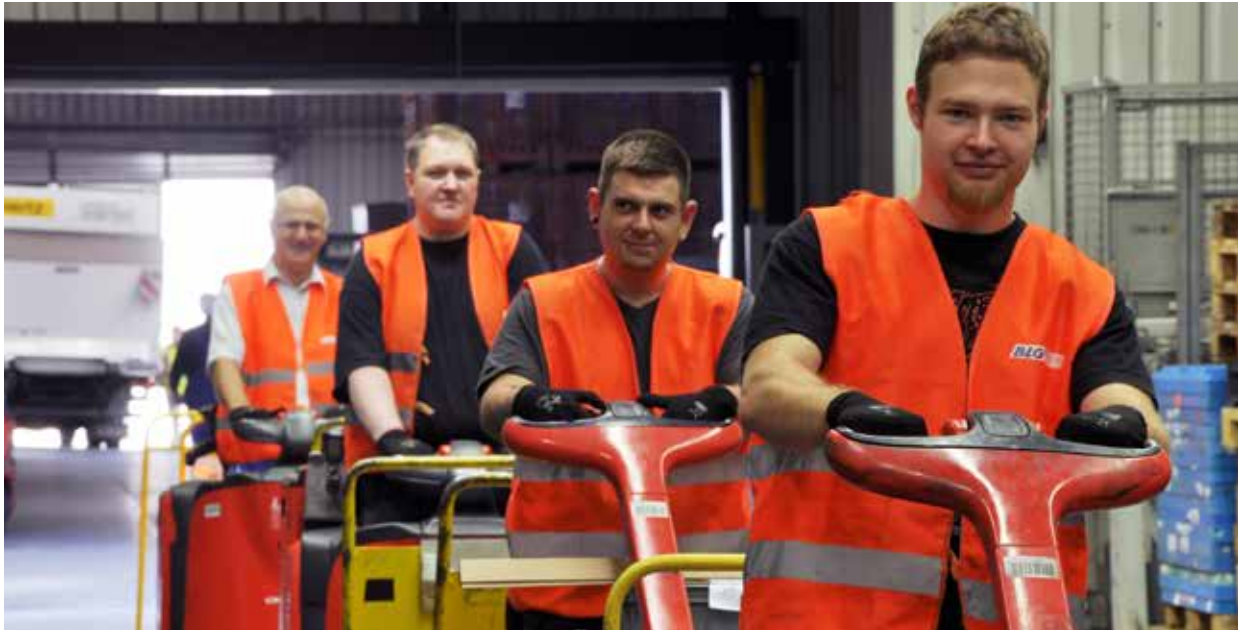
BLG-Mitarbeiter in Brotterode