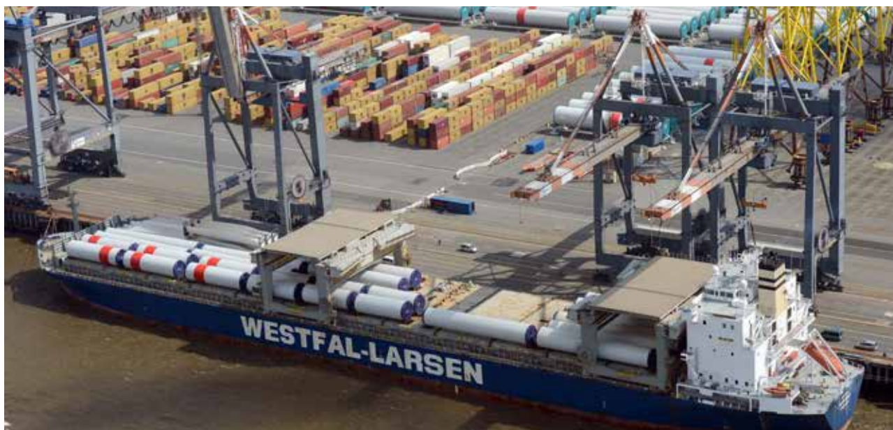
Projektverladung in Bremerhaven

Dieser Zwischenbericht enthält zukunftsbezogene Aussagen, die auf aktuellen Einschätzungen des Managements über künftige Entwicklungen beruhen. Solche Aussagen unterliegen Risiken und Unsicherheiten, die außerhalb der Möglichkeiten von der BREMER LAGERHAUS-GESELLSCHAFT –Aktiengesellschaft von 1877– bezüglich einer Kontrolle oder präzisen Einschätzung liegen, wie beispielsweise das zukünftige Marktumfeld und