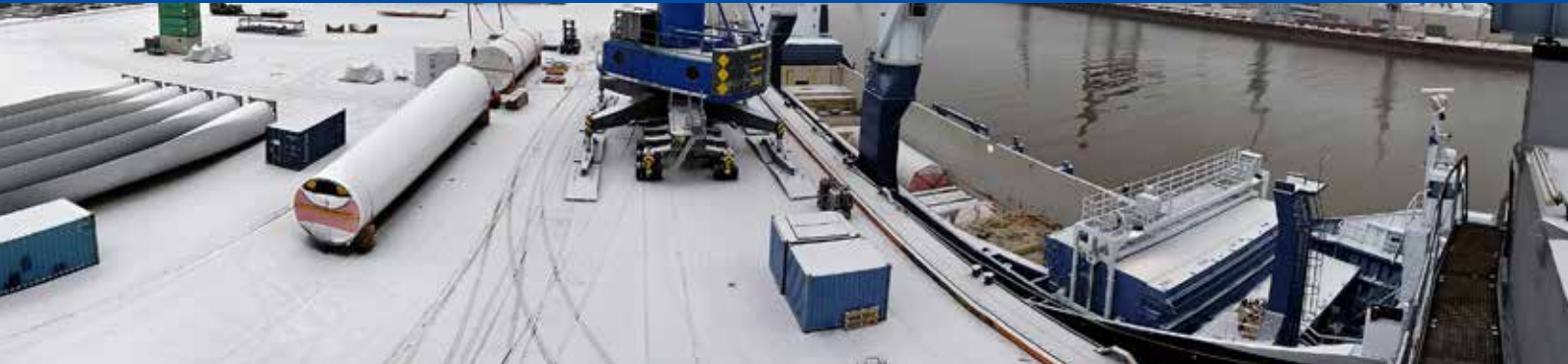
Projektverladung in Bremen