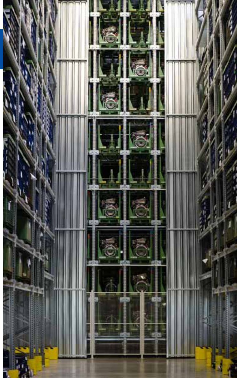
Logistik für die Industrie

Corporate Governance umfasst das gesamte System der Leitung und Überwachung eines Unternehmens einschließlich der Organisation des Unternehmens, seiner geschäftspolitischen Grundsätze und Leitlinien sowie des Systems der internen und externen Kontroll- und Überwachungsmechanismen. Corporate Governance strukturiert eine verantwortliche, an den Prinzipien der sozialen Marktwirtschaft und auf nachhaltige Wertschöpfung ausgerichtete Leitung und Führung des Unternehmens.