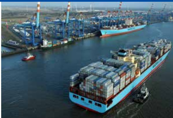
Containerverladung in Bremerhaven

schlusses sowie der Prüfung dar. Hiervon betreffen TEUR 180 das Jahr 2013. Weitere TEUR 100 (31. Dezember 2012: TEUR 211) sind für fixe und variable Aufsichtsratsvergütungen zurückgestellt worden.