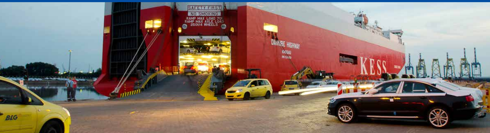
Automobilverladung in Bremerhaven

zum 31. Dezember 2013 datiert waren, einvernehmlich zum 31. Mai 2013 aus dem Unternehmen aus.