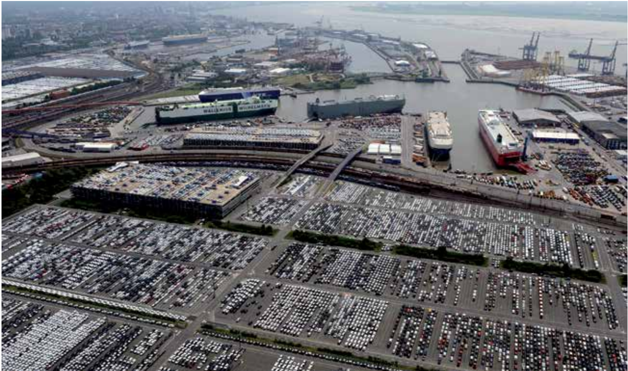
Teilansicht AutoTerminal in Bremerhaven

die wirtschaftlichen Rahmenbedingungen, das Verhalten der übrigen Marktteilnehmer, die erfolgreiche Integration von Neuerwerbungen und Realisierung der erwarteten Synergieeffekte sowie Maßnahmen staatlicher Stellen. Sollte einer dieser oder andere Unsicherheitsfaktoren und Unwägbarkeiten eintreten oder sollten sich Annahmen, auf denen diese Aussagen basieren, als unrichtig erweisen, könnten die tatsächlichen Ergebnisse wesentlich von den in diesen Aussagen explizit genannten oder implizit enthaltenen Ergebnissen abweichen. Es ist von der BREMER LAGERHAUS-GESELLSCHAFT –Aktiengesellschaft von 1877– weder beabsichtigt, noch übernimmt die BREMER LAGERHAUS-GESELLSCHAFT –Aktiengesellschaft von 1877– eine gesonderte Verpflichtung, zukunftsbezogene Aussagen zu aktualisieren, um sie an Ereignisse oder Entwicklungen nach dem Datum dieses Berichts anzupassen.