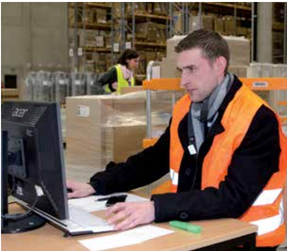
BLG-Mitarbeiter in Butzbach

Sofern das Tantiembudget nach Gewährung der variablen Jahrestantieme noch nicht ausgeschöpft ist, steht der verbleibende Restbetrag für die variable nachhaltige Tantieme zur Verfügung. Diese wird in Abhängigkeit von der Erreichung des Konzernergebnisses vor Ertragsteuern (EBT) in den drei Folgejahren auf Basis der im Aufsichtsrat verabschiedeten Planung gewährt. Weiteres Kriterium ist das Erreichen des Return on Capital Employed (ROCE) auf Basis der mit dem Aufsichtsrat vereinbarten Dreijahresplanung. Damit stimmen die Kriterien für die Gewährung der Tantieme als Leistungsanreiz mit den im Konzern verwendeten Steuerungskennzahlen überein.