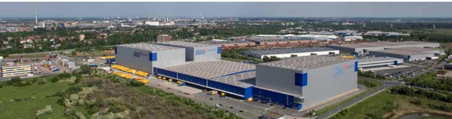
Logistik für den Handel

Der Aktienbesitz der Vorstands- und Aufsichtsratsmitglieder insgesamt beträgt zum 30. Juni 2013 weniger als ein Prozent der von der Gesellschaft ausgegebenen Aktien.