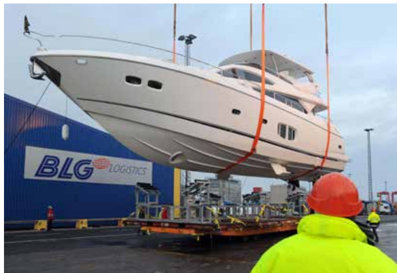
High & Heavy-Verladung in Bremerhaven

Die Gesellschaft unterhält eine Zweigniederlassung in Bremerhaven.