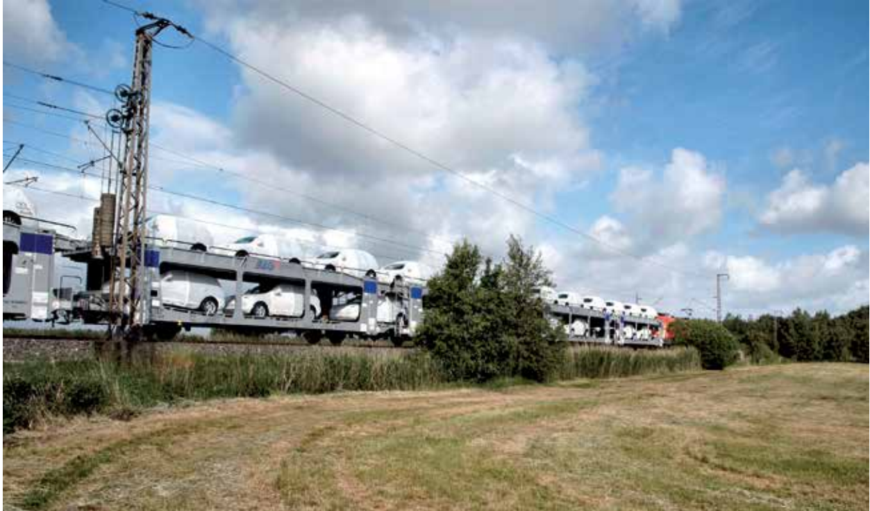
Transportlogistik für die Automobilindustrie

zwischen 40 und 60 Prozent vom ruhegeldfähigen Jahreseinkommen, das deutlich unterhalb des jeweiligen Jahresgrundgehalts (feste Vergütung eines Vorstands) liegt. Die ruhegeldfähigen Jahreseinkommen der Vorstände werden analog zu den Tarifierhöhungen des ZDS (Zentralverband der Deutschen Seehafenbetriebe) angepasst.