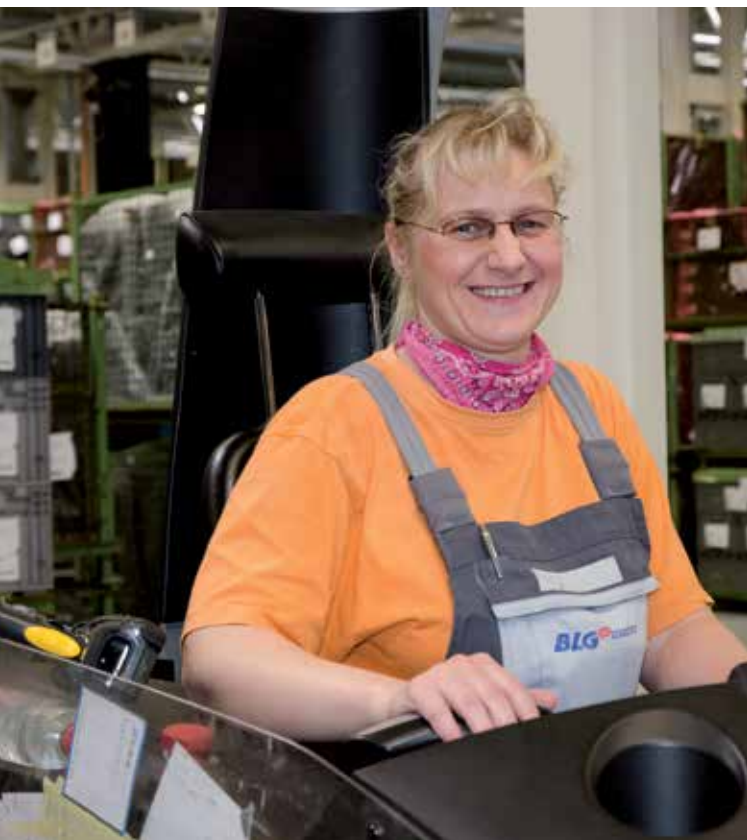
BLG-Mitarbeiterin in Kölleda